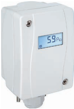
Digitaler Drucksensor Nova P/V mit beleuchtetem Display

Die Filterüberwachung sollte über die Regelung erfolgen, um bei steigender Verschmutzung des Filters die Ventilator Drehzahl anzupassen. Zusätzlich muss sie von außen ablesbar sein. Dafür hat NOVA einen digitalen Drucksensor entwickelt, welcher beide Funktionen zuverlässig erfüllt.